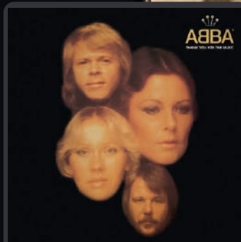
TY. for the Music

Nos dias atuais, as músicas banda se manifestam por meio de plataformas como YouTube, Spotify e até mesmo num dos apps mais populares do momento; o Tiktok.