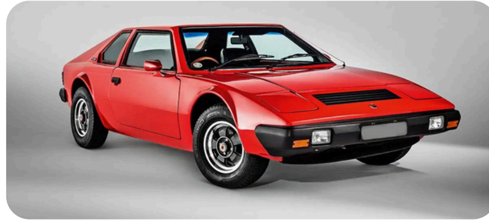
Farus ML 929