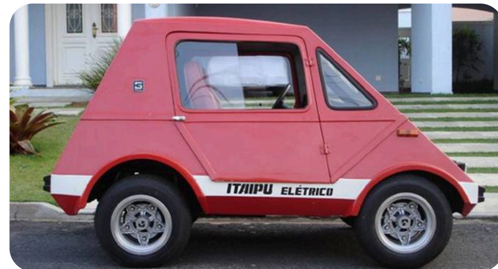
Gurgel Itaipu Elétrico