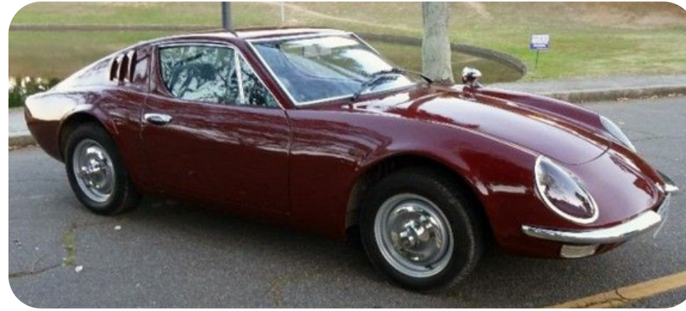
Puma GT 1500