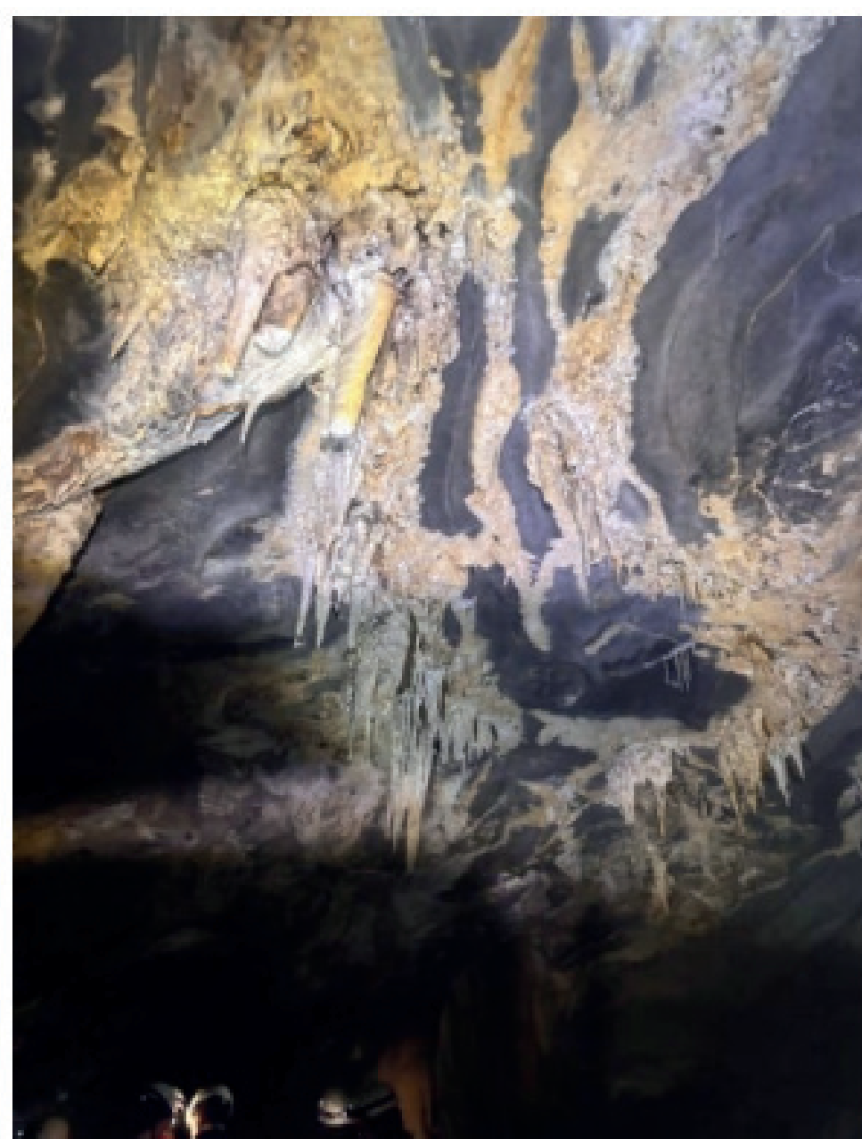
Teto da Caverna dos Paiva