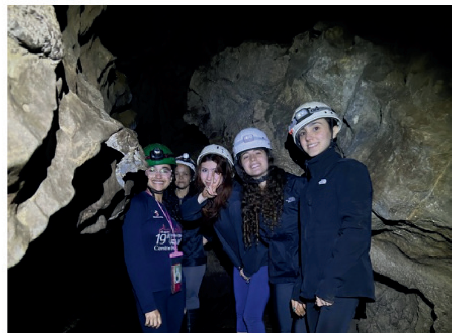
Visita a Caverna Colorida

Relatar a experiência vivida, abordando a história do parque, identificação de características físicas e geológicas, bem como a observação e classificação das formas de vida do ambiente.