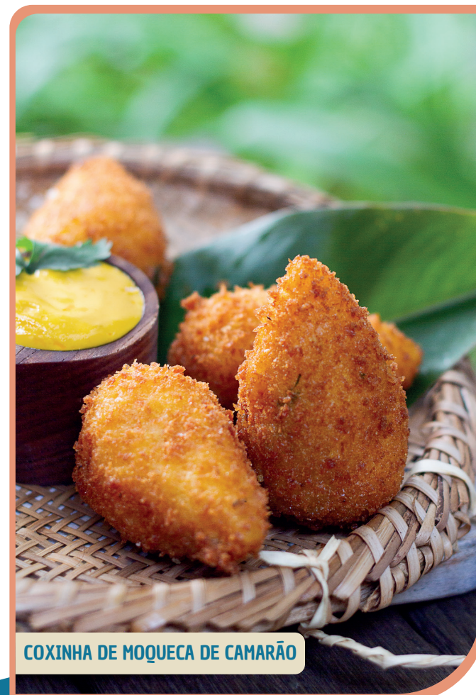
COXINHA DE MOQUECA DE CAMARÃO