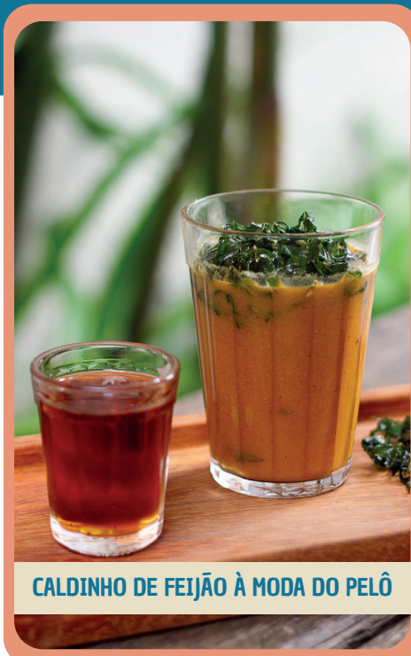
CALDINHO DE FEIJÃO À MODA DO PELÔ