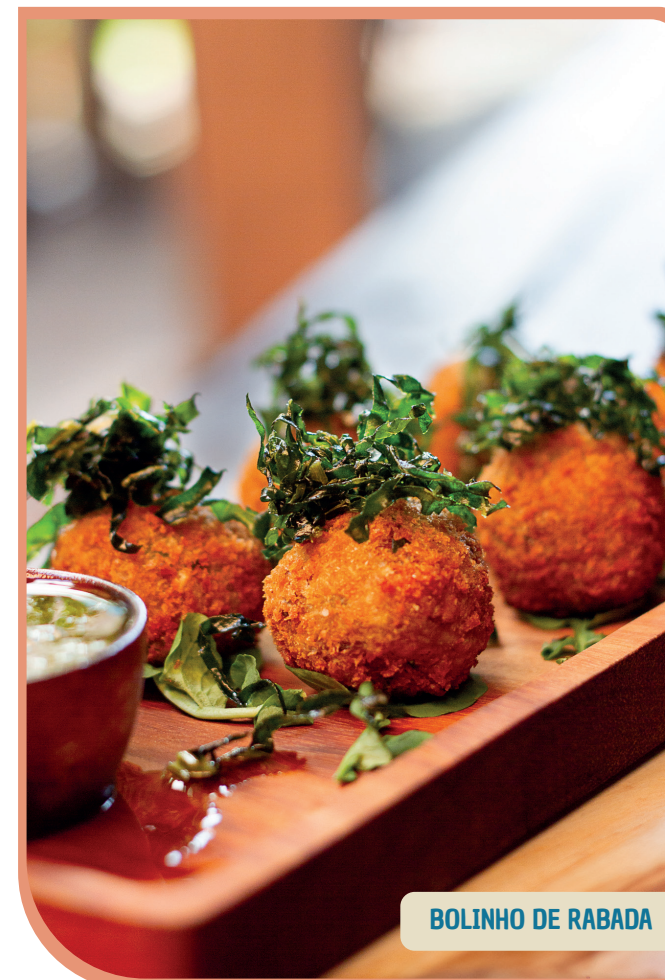
BOLINHO DE RABADA