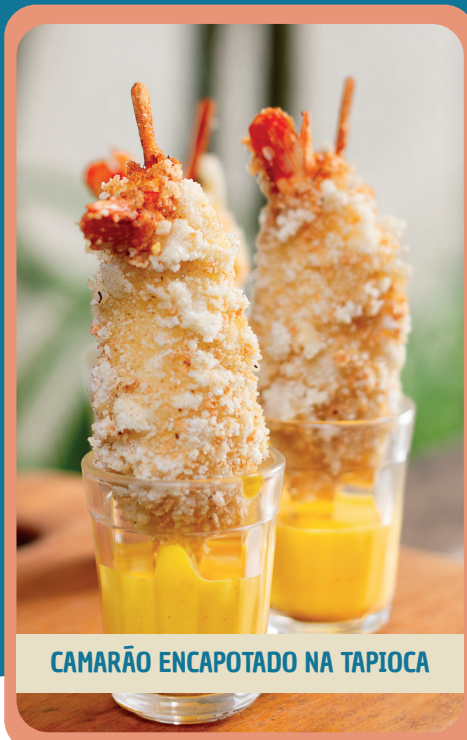
CAMARÃO ENCAPOTADO NA TAPIOCA