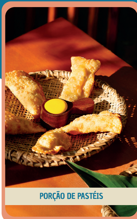
PORÇÃO DE PASTÉIS