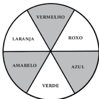
Fig.1: o círculo de cores de Goethe

Os campos das cores primárias são desenhados com linhas mais grossas, e os das cores secundárias situam-se entre eles. Cada cor secundária – o verde, por exemplo –, pode se aproximar tanto da cor primária quanto da cor secundária que a compõe. Dependendo da cor, o resultado é um verde mais amarelado ou mais azulado. É possível criar uma gama infinita de cores simplesmente misturando as três cores básicas em diferentes proporções. É claro que não ensinamos a teoria das cores às crianças no Jardim de Infância, mas oferecemos a oportunidade de experimentarem como as diferentes cores se desenvolvem no papel de forma criativa e prática. Para isso, o uso de tintas de aquarela da melhor qualidade é o mais recomendável, pois são mais fáceis de misturar e apresentam tons mais puros do que, por exemplo, as tintas guache.